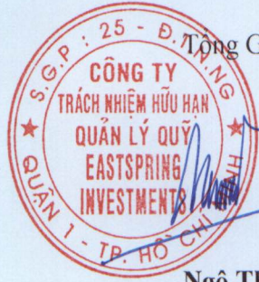
Ngô Thế Triệu